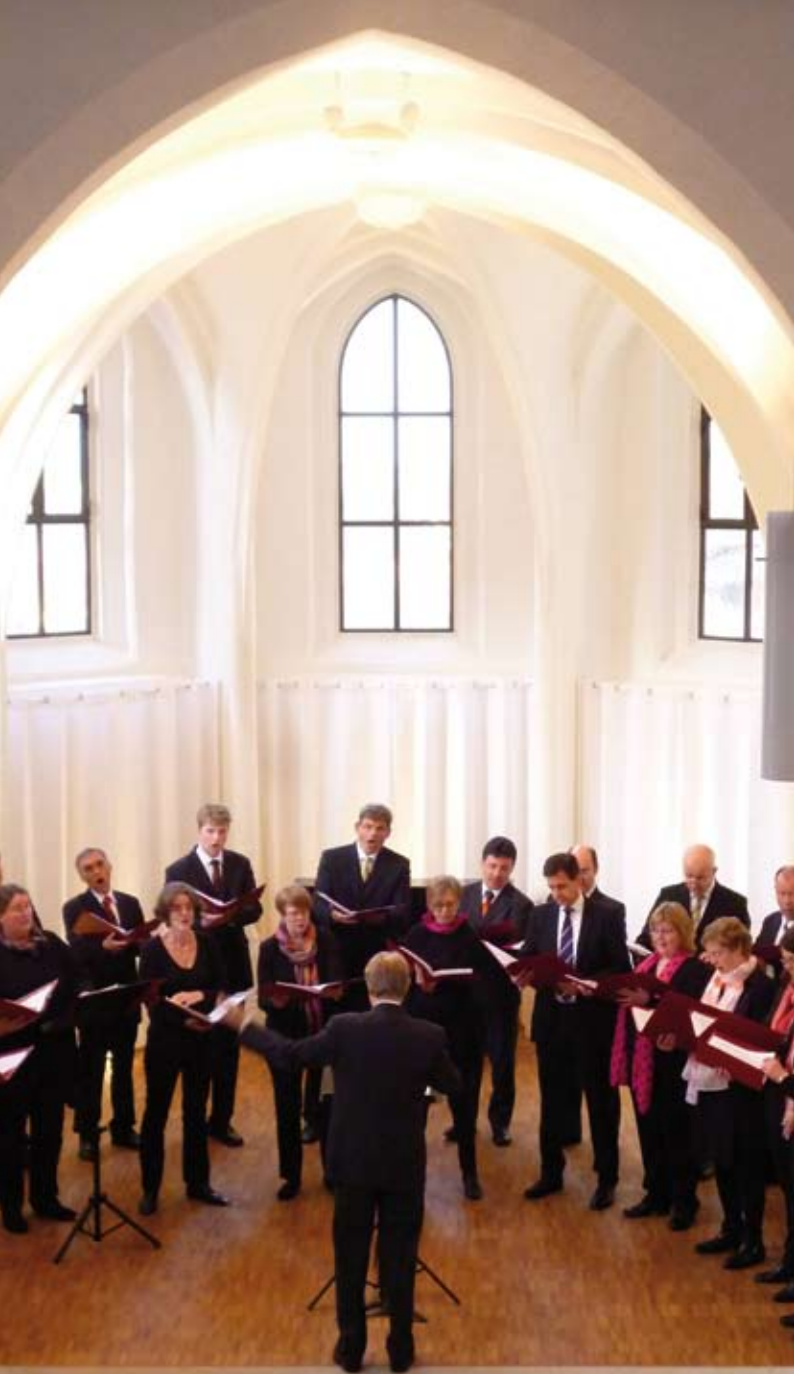
Kammerchor Vocalis (Frankfurt/M.) in der St. Johanniskapelle